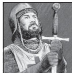
Godfried van Bouillon