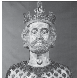
Karel de Grote