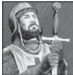
Godfried van Bouillon